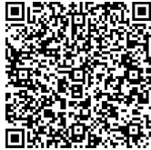
Sello Digital del CFDI

VcZPSX2qkWDI+wn8u8T2UogTgCrwJG04oxbYO+Zv0x NpYqfdmgxQEggKPwEhr4n5z6AiSmPEMrFLSiMoA/ x4hj1BfAA2HWebUBSjQ8INu5PHzT4kznVPdHjxxNMqX hzR+LG+Zfgr2MyNF5cmZYUohZwP3svChTECJWnJaxR ZtT/Og7E/kDU/ta6lDMzWd/