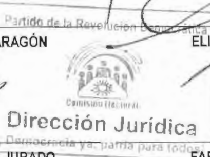
FABIÁN CALOCA MENDOZA COMISIONADO