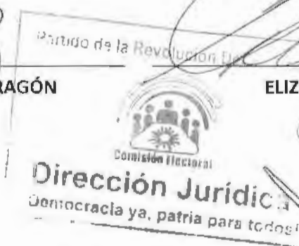
FABIAN CALVO MENDOZA COMISIONADO