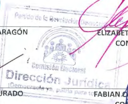
FABIAN COLUCA MENDOZA COMISIONADO