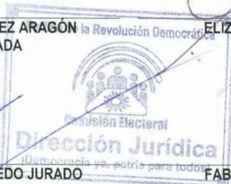
FABIAN CALOCA MENDOZA COMISIONADO