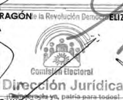
FABIAN CALOC MÉNDEZ COMISIONADO